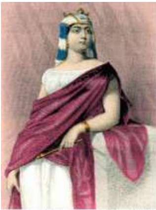
La regina Gezabele. Riproduzione da: "Le donne della Bibbia" (W. J. Edwards, Firenze, 1899).

Ad Omri succede Acab nell'anno 838: “Acab eresse anche un palo sacro e compì ancora altre cose, irritando il Signore Dio di Israele, più di tutti i re di Israele suoi predecessori.” 1 Re 16, 33.