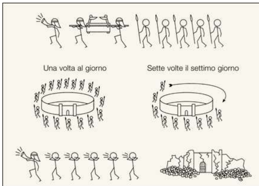
La presa di Gerico

Rimane valido il discorso degli Ebrei, che girano in silenzio intorno a Gerico, per sette giorni, esplodendo con il grido di “Teruah”.